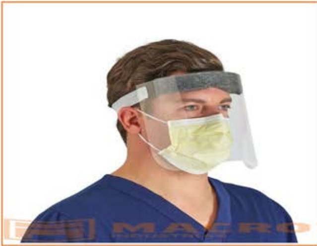
CARETA PARA PROTECCION (PVC) CÓDIGO CFA 05